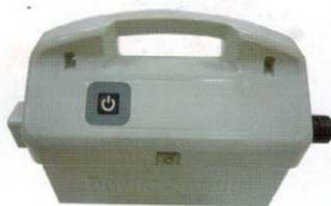
24 volts sécurité totale

Le transformateur de tension 24 volts assure la sécurité électrique dans le bassin.